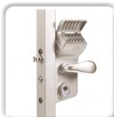
Serrure à code mécanique