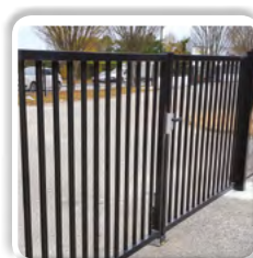
Portail pivotant Professionnel