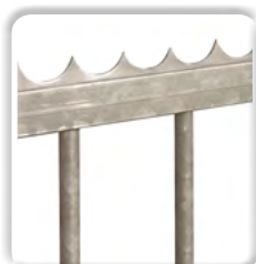
Lisse défensive à souder ou à visser