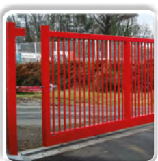
Portail coulissant Industriel