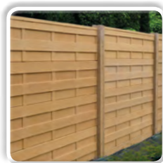
Clôture béton décorative Claustra