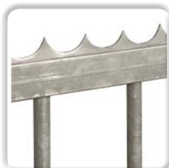
LISSE DÉFENSIVE à souder ou à visser