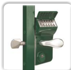
SERRURE À CODE MÉCANIQUE