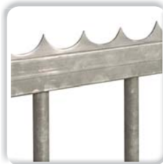
LISSE DÉFENSIVE à souder ou à visser