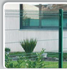
PANNEAU RIGIDE HERCULES®