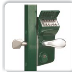
SERRURE À CODE MÉCANIQUE