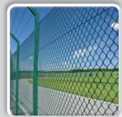
GRILLAGE SIMPLE TORSION