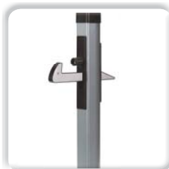
ARRÊTOIR À BASCULE