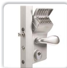
SERRURE À CODE MÉCANIQUE