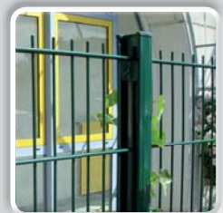
PANNEAU RIGIDE DOUBLE FIL