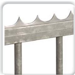
LISSE DÉFENSIVE à souder ou à visser