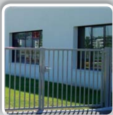
PORTAIL PIVOTANT SUR-MESURE