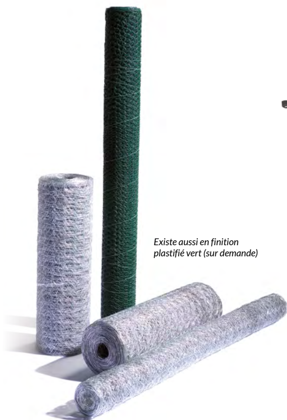
Existe aussi en finition plastifié vert (sur demande)

Le grillage triple torsion est un grillage de maille hexagonale recommandé pour l'aviculture, la cuniculture, la construction de cages et les armatures. Sa souplesse en fait un produit facile à poser et à mettre en forme.