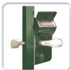
SERRURE À CODE MÉCANIQUE