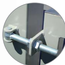
Gonds permettant une ouverture des vantaux à 180°