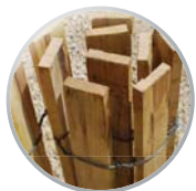
Treillage en lattes