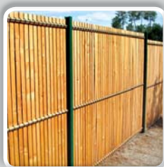
OCCULTATION KIT BOIS