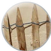
Treillage en échalas triangulaires