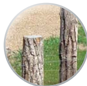
Treillage en échalas bruts