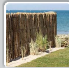
CLÔTURE DE GIRONDE