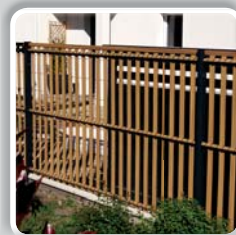
OCCULTATION KIT PVC