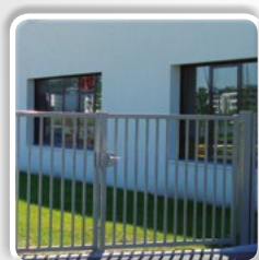
PORTAIL PIVOTANT SUR-MESURE