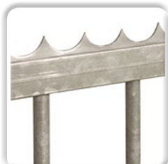
LISSE DÉFENSIVE à souder ou à visser