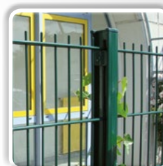
PANNEAU RIGIDE DOUBLE FIL