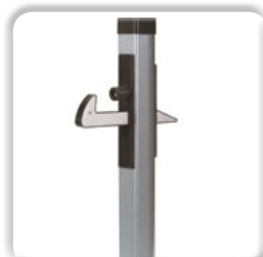
ARRÊTOIR À BASCULE