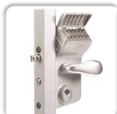
SERRURE À CODE MÉCANIQUE