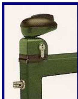
Serrure Ral 6005