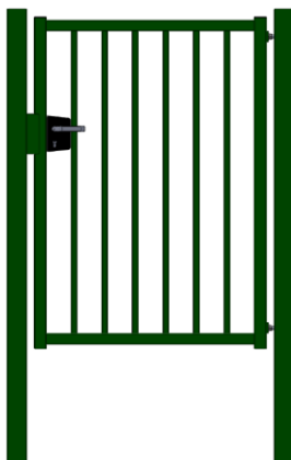
Vue intérieure piles à sceller