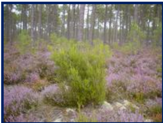
Bruyère des landes ou Brande

fil galvanisé Ø 2,7mm pour la trame et Ø 1,3mm pour le parement.