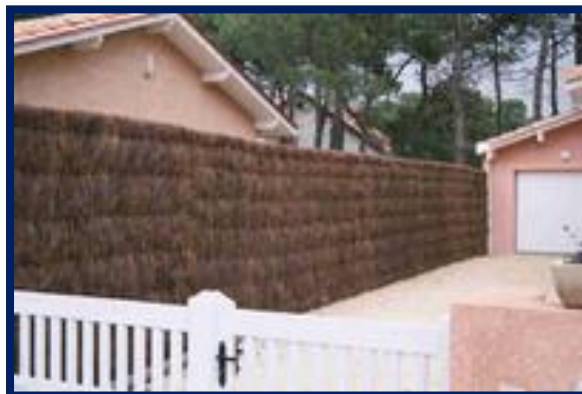
Panneau en Brande