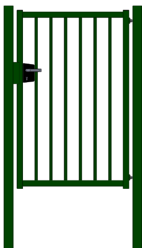
Vue intérieure piles à sceller