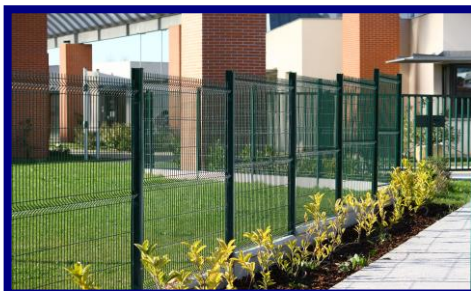
Possibilité de dénivellation