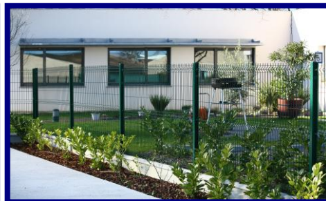
Soubassement béton éventuellement