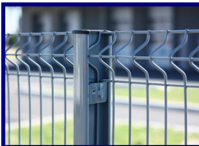
Clips de fixation Aluminium